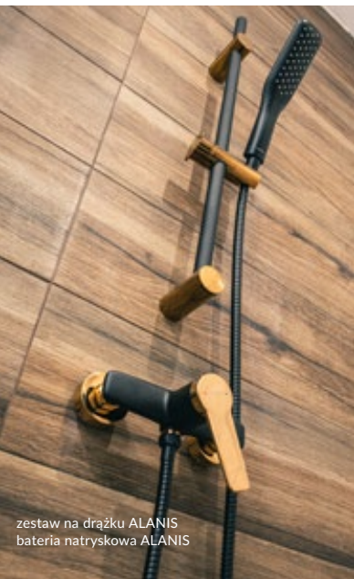
zestaw na drążku ALANIS bateria natryskowa ALANIS