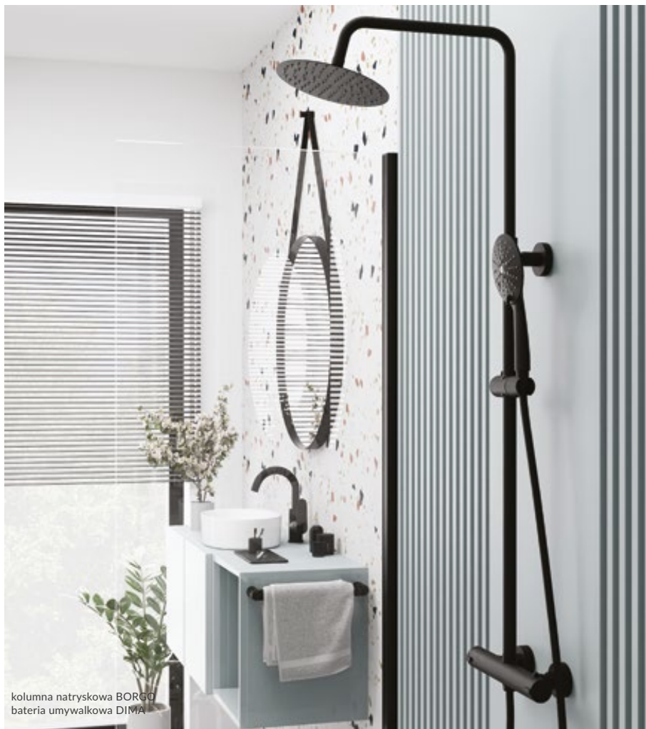
kolumna natryskowa BORGO bateria umywalkowa DIMA