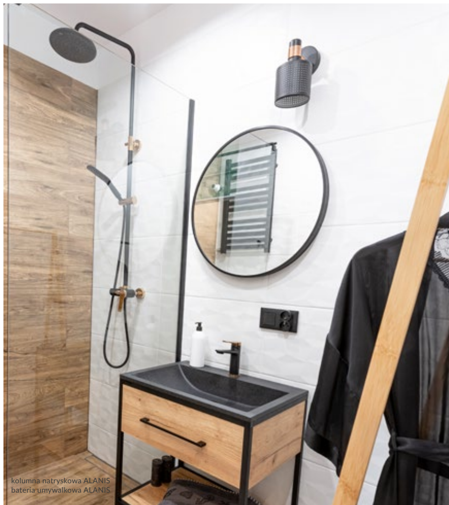
kolumna natryskowa ALANIS bateria umywalkowa ALANIS