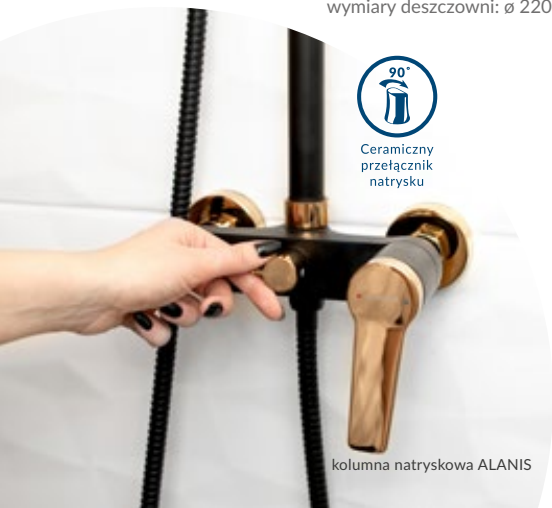
kolumna natryskowa ALANIS