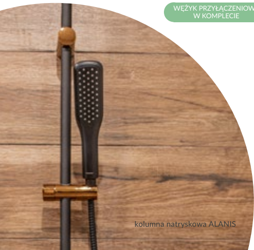
kolumna natryskowa ALANIS